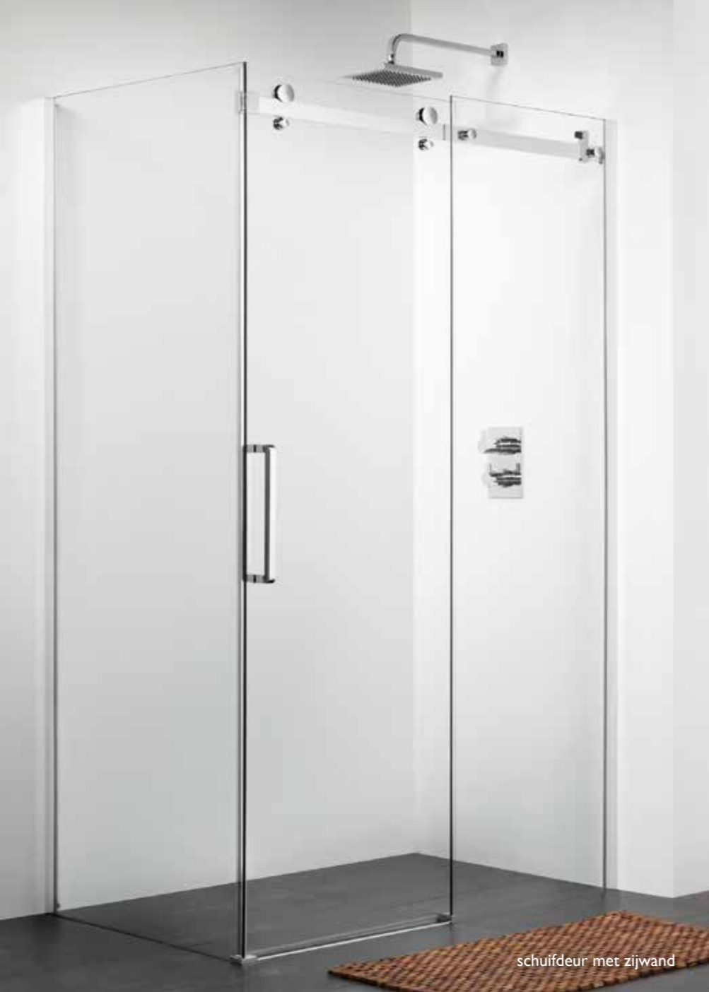
schuifdeur met zijwand