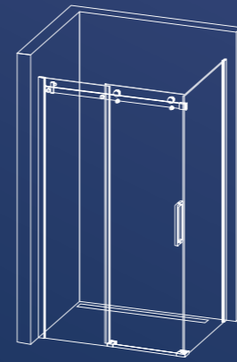
Schuifdeur met zijwand 118 x 87,5 x 206 cm zowel als linker en rechter variant te monteren